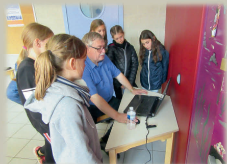
Ecole Communale FELUY