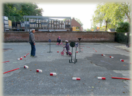
Ecole Saint-Louis JURBISE