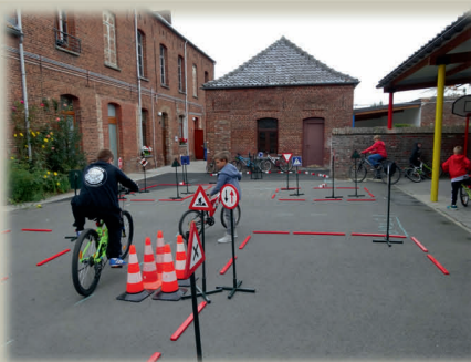
Ecole Communale CAMBRON-SAINT-VINCENT