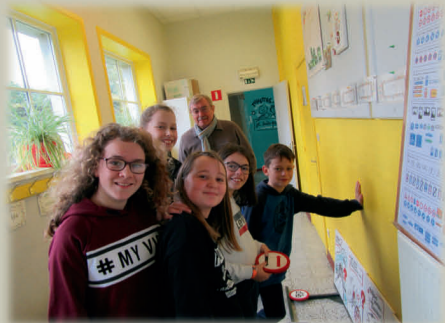
Ecole Communale WEZ-VELVAIN