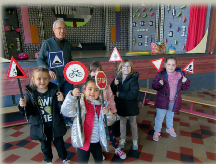
Ecole Communale PERONNES-LEZ-BINCHE