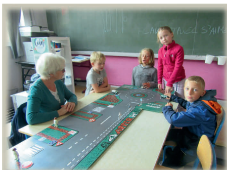
Ecole Communale HAVINNES

Depuis la rentrée scolaire de septembre de nombreuses écoles ont reçu la visite de nos délégués toujours aussi motivés d'initier les élèves au code de la route et leur apprendre les bons comportements de sécurité routière.