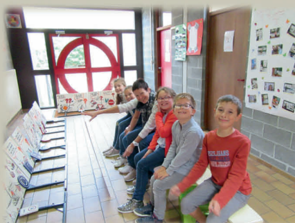
Ecole Communale WODECQ