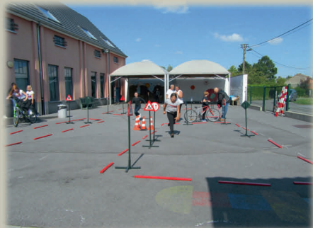
Ecole Communale LAPLAIGNE