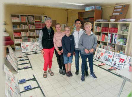
Ecole Camille Depinoy TEMPLEUVE